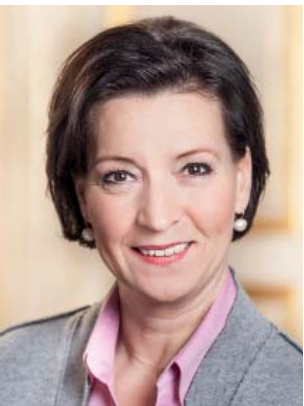
Gabriele Heinisch-Hosek Bundesministerin für Bildung und Frauen